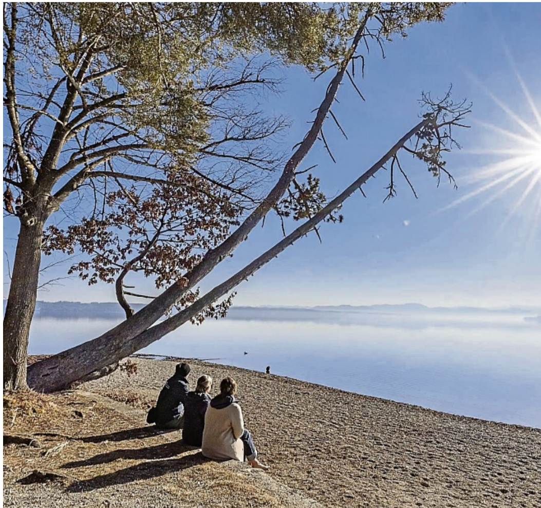
Wird heute gefällt: der Karibikbaum beim Tutzinger Midgardhaus. Das Rathaus sah keine Möglichkeit, den Baum in seiner jetzigen Form zu erhalten.