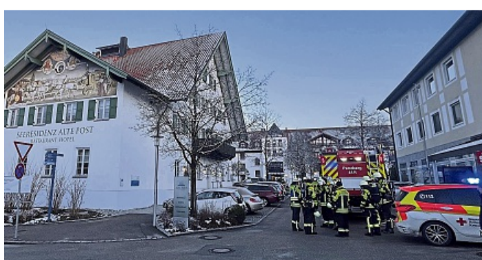
Ein Großaufgebot an Rettungskräften war am Sonntagnachmittag zur Seeresidenz Seeshaupt geeilt.

Wie Penzbergs Polizeichefin Susanne Kettl sagte, hatte die Brandmeldeanlage im Gebäude am Nachmittag angeschlagen. Die Alarmierung sei um 16.26 Uhr erfolgt. Der Brand sei in einem Zimmer im Erdgeschoss der exklusiven Seniorenresidenz ausgebrochen. Zahlreiche Feuerwehr- und Polizeifahrzeuge sowie mehrere Krankenwagen standen am späten Nachmittag rund um das Gebäude am Südufer des Starnberger Sees, rund 100 Meter davon entfernt hielten sich weitere Rettungswagen des BRK bereit. Laut dem Weilheimer Kreisbrandrat Rüdiger Sobotta waren an dem Einsatz sieben Feuerwehren mit insgesamt etwa 130 Einsatzkräften